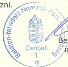
Bende Zsolt igazgató