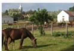
Salföldi Major, Salföld