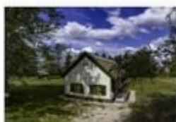
Fekete István-emlékhely, Kis-Balaton / Fenékpusztza / Diás-sziget