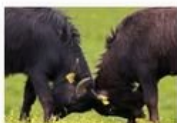
Kápolnapusztza Bivalyrezervátum, Kis- Balaton