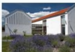
Levendula Ház Látogatóközpont, Tihany