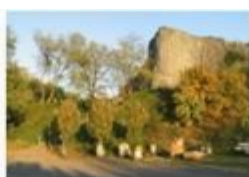
Hegyestű Geológiai Bemutatóhely, Monoszló