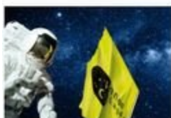
Pannon Csillagda, Bakonybél