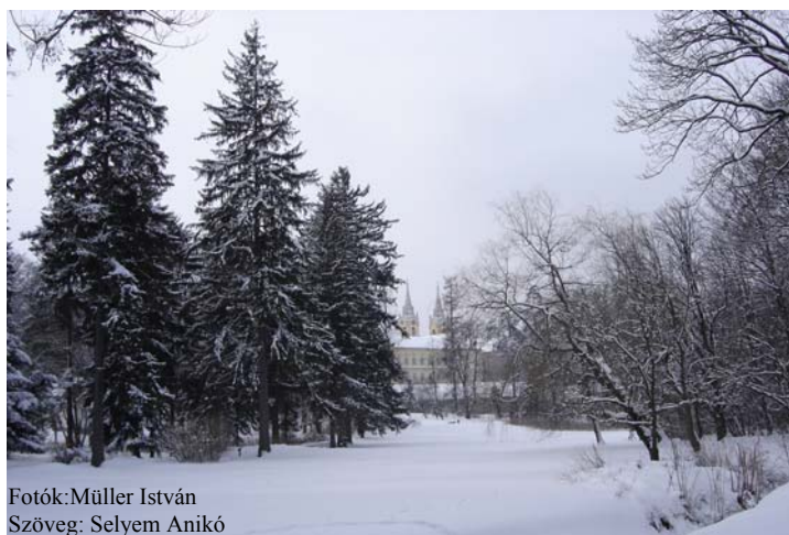
Szöveg: Selyem Anikó

A rekonstrukció részeként a kert infrastruktúrája szempontjából nélkülözhetetlen munkálatok is történnek: két fahíd felújítása a patak felett, valamint a védelmi kerítés cseréje. A botanikus kert gyarapodik mind a növénygyűjtemény, mind a jelenlevő védett állatfajok tekintetében; ezt szolgálja a vizes élőhelyek kialakítása, további denevérodúk kihelyezése és az arborétum növényzetének megválasztása, a számos énekesmadár faj igényeit kielégítő kertrészletek létrehozása. A tervezett rekonstrukció reményeink szerint 2009. őszén megkezdődik.