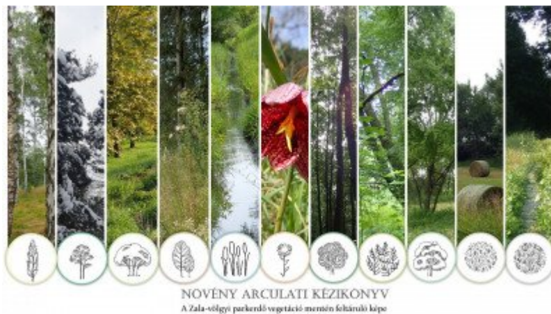
NÖVÉNY ARCULATI KÉZIKÖNYV A Zala-völgyi parkerdő vegetáció mentén feltáruló képe

Egy erdőállomány vegetáció mentén feltáruló képe